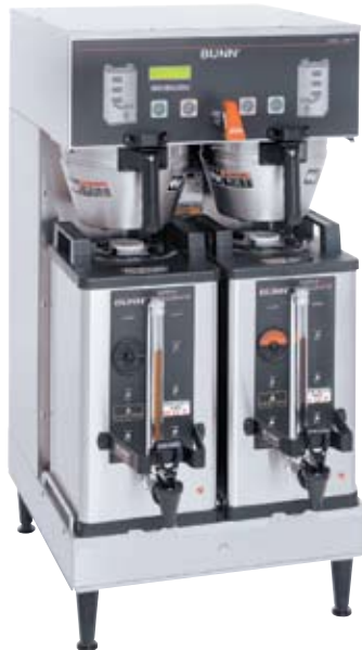
Modèle Dual SH DBC serveurs SH 1,5 gallon